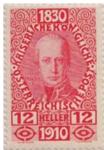
type II 1910 uitgifte