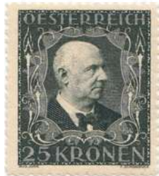
type II - tanding 11 1/2

Bruckner's Magnificat is beïnvloed door Mozart's Vespers. Bruckner's graduaal Locus heeft dan weer een sterk verband met de rol van de priester in Mozart's Toverfluit.