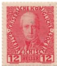
type I 1908 uitgifte

De jacht op klassieke en gegraveerde zegels, boekjes, tandingen, publicitaire bijdrukken en particuliere postzegels op bestelling is geopend op de nationale postzegelbeurzen.