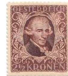
type II - tanding 11 1/2

De zegel van Haydn maakt deel uit van een reeks van componisten uitgegeven in 1922 in Oostenrijk tegen verhoogd tarief ten voordele van artiesten in nood. Er bestaan 2 types, één met de standaard tanding 12 1/2 op 2 cm en een ander met tanding 11 1/2.