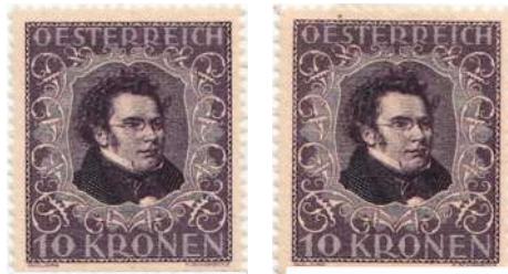
type I tanding 12 1/2 type II tanding 11 1/2

omvang en opzet. Het lied van Schubert over Orpheus is dan weer gebaseerd op de rol van Tamino in de Toverfluit van Mozart.