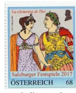
particuliere zegel op bestelling