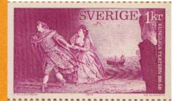
Czeslaw Slania gravure