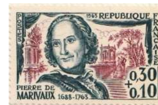
Albert Decaris gravure

Wolfgang schreef een bundel van zes strijkkwartetten voor de oudere componist Joseph Haydn. Hij noemde hem daarom zelfs papa Haydn.