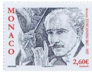
Pierre Albuissou gravure

Toscanini nam Mozart's 40ste symfonie op in 1939 voor een uitgifte op 78 toeren plaat. De versie werd door de critici afgebroken omdat ze te dynamisch en te intensief was. In 1950 werd de symfonie opnieuw opgenomen.